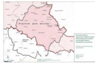
Slika 9: Fasade: Priključitve in ključni za opredeljene elemente za obkroženje, občina Moravske Toplice