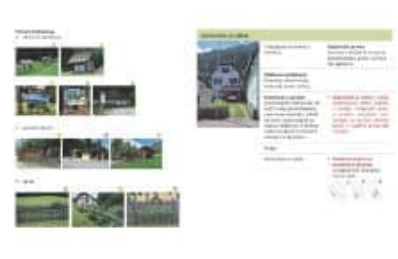
Slika 4: Primer analize in vrednotenja stanja v občini Solbica za elemente obkroženja, pomožni objekti in ograje