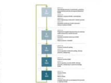
Slika 1: Osnovni in ključni elementi korakov priprave OUPK