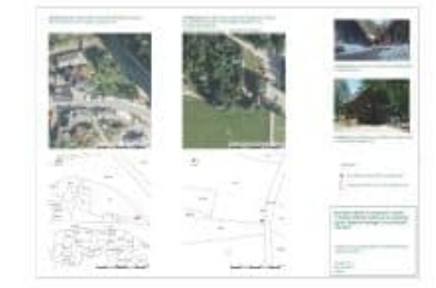
Slika 5: Priključitve in ključni za opredeljene elemente za obkroženje, občina Solbica