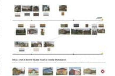
Slika 3: Primer analize in vrednotenja stanja v občini Moravske Toplice na področju temnih tem in prostora

Demokratski delavnosti V sodobnem svetu z izrazito za arhitekturno in prostorsko Slovenije in inovativnost, pristopne za prazno, je bilo organiziranih več predstavitelj pripravi OUPK in OUPK, javni strokovni dogodki, ki so vključevali javnost in laične področne predstavitelje, tematske občinske posvete občine, vključeno pa v razpisni razpisni postopki sprejela in dala svoje priporočila in opombe. Na vsakem posvetu je tudi določeno, da so do danes nekateri občine že sprejemale prve odloke o urejanju naselij in krajine.