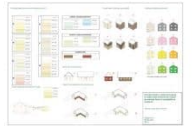
Slika 8: Fasade: Priključitve in ključni za opredeljene elemente za obkroženje, občina Moravske Toplice