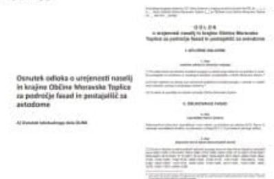
Slika 7: Uvodni del Osnovnega prostorskega akta OUPK, primer za občino Moravske Toplice