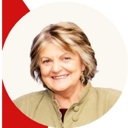
Elisa Ferreira Evropska komisarka za kohezijo in reforme