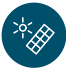
Elektrarna za vsakogar

S postavitvijo skupnostnih sončnih elektrarn članom sončne skupnosti omogočamo dolgoročni najem posameznih panelov, s katerim bodo postali delno energetska samooskrbni in neodvisni od nihanj mednarodnih cen električne energije.