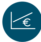
Prihranki za dom