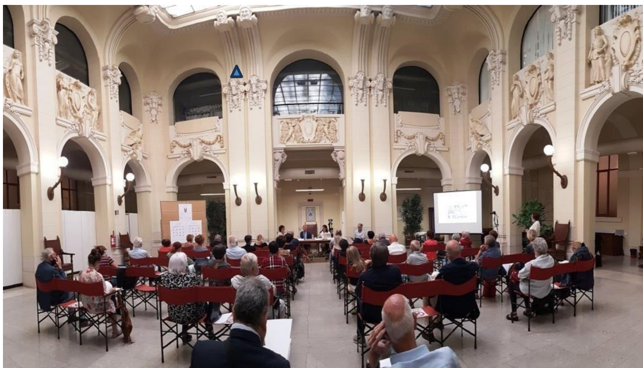
Slika 6: Mestna dvorana v Videmu (Salone del Popolo)