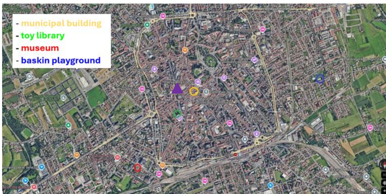
Slika 5: Italijansko mesto Videm in predvideni ogledi lokacij oziroma predstavitev (Restaurant Alla Ghiacciaia ▲)