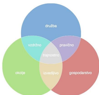
Slika 1: Trajnostni razvoj

Skupnost občin Slovenije organizira v tesnem sodelovanju z mestoma Videm ( italijansko Udine ) in Nova Gorica celodnevno strokovno ekskurzijo. V središčih italijanske dežele Furlanija – Julijske krajine na severovzhodu Italije in Goriške statistične regije na zahodu Slovenije bomo tekom ekskurzije imeli priložnost prisluhni različnim družbenim vidikom urejanja prostora.