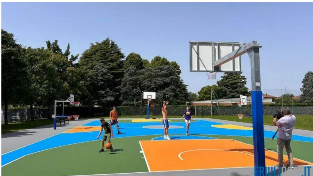
Slika 3: Baskin v Videmu

Ob prihodu v mesto Videm in sprejemu predstavnikov tamkajšnjega mesta, bo sledila predstavitev dobrih praks. Predstavljena bo kampanija za varnost ranljivih udeleženk in udeležencev v prometu kot tudi pobuda »ESPERTOover65« . Kampanija je ciljno usmerjena v izboljšanje dostopnosti mesta, zlasti ob upoštevanju varnosti in trajnosti gibanja starejših od 65 let in spodbujanju družabnosti in živahnosti javnih prostorov. Cilj kampanje je razviti in preizkusiti model delovanja, ki je interdisciplinaren in medsektorski ter združuje znanja, dejavnosti in ukrepe za spodbujanje zdravja in kakovostnega staranja.