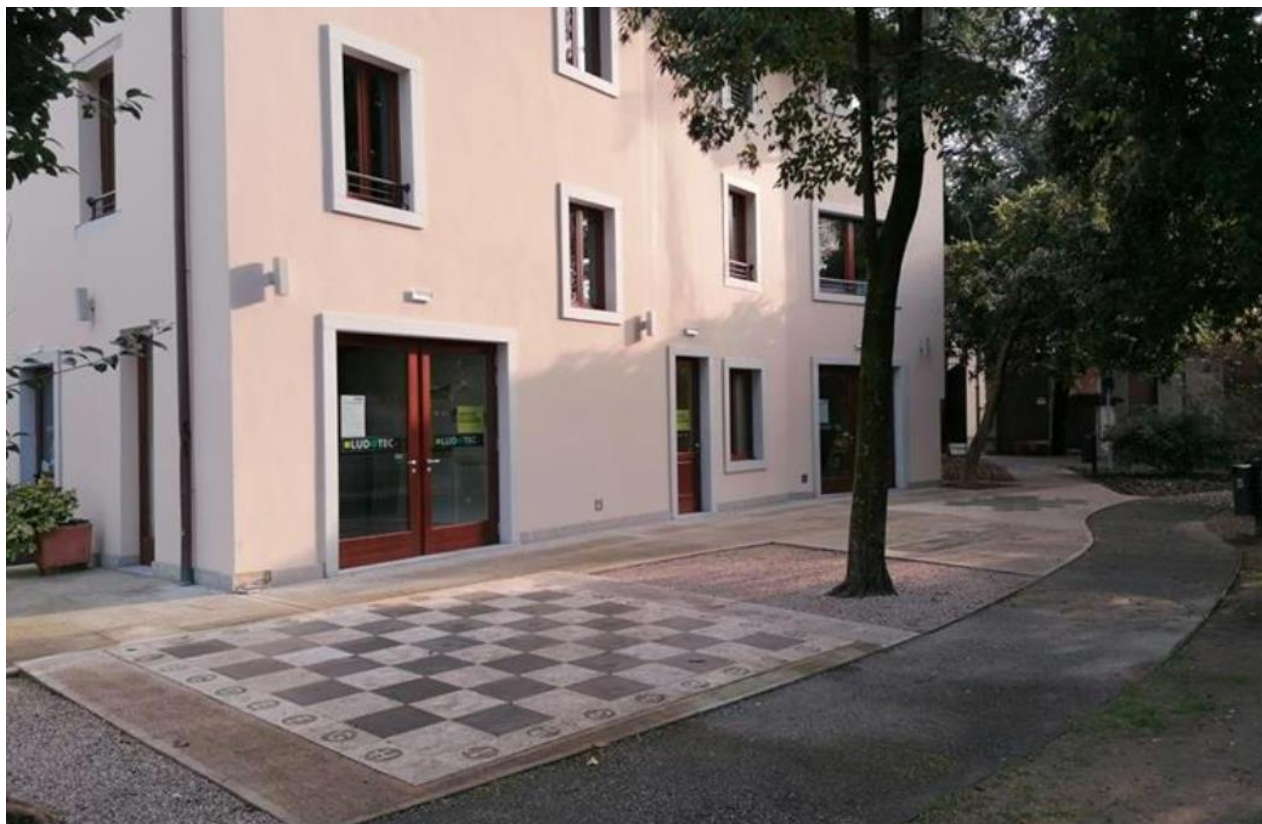
Slika 4: Knjižnica igrač v Videmu

Sledil bo obisk Knjižnice igrač (italijansko Ludoteca Comunale ), ki je financirana s strani tamkajšnje občine. Samo knjižnico si bomo tekom ekskurzije tudi ogledali od zunaj in od znotraj ter se seznanili z aktivnostmi, zbirkami in drugimi zanimivostmi knjižnice. Knjižnica je pravzaprav odgovor mesta Videm na aktualne urbane izzive vse od premajhnega vključevanja lokalne skupnosti, osamljenosti, izoliranosti in staranja prebivalstva kot tudi spodbujanje aktivnega življenjskega sloga.