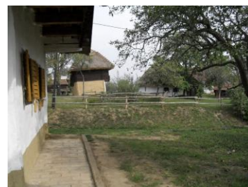
Slika 3: Vas Sola/Szalafő Pityerszer (●)

Sola (madžarsko Szalafő ) je majhna vas v Železni županiji na Madžarskem, blizu slovenske meje, znana po ohranjeni tradicionalni arhitekturi in bogati pastirski dediščini z muzejem na prostem Pityerszer.