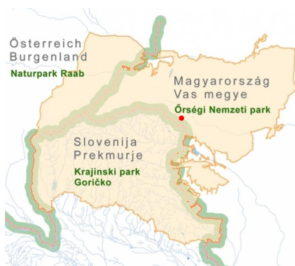
Slika 2: Trideželni park Goričko-Raab-Órség

Narodni park Órség se nahaja na zahodu Madžarske v županiji Vas, tik ob slovenski meji, in predstavlja eno najbolj ohranjenih kulturnih krajin v regiji. Gre za pomembno zavarovano območje z izjemno naravno in kulturno vrednostjo, znano po mozaični krajini travnikov, gozdov, mokrišč ter razpršene poselitve, ki odraža stoletja trajnostnega sobivanja človeka z naravo v nekdanji stražni krajini. Območje odlikuje bogata biotska