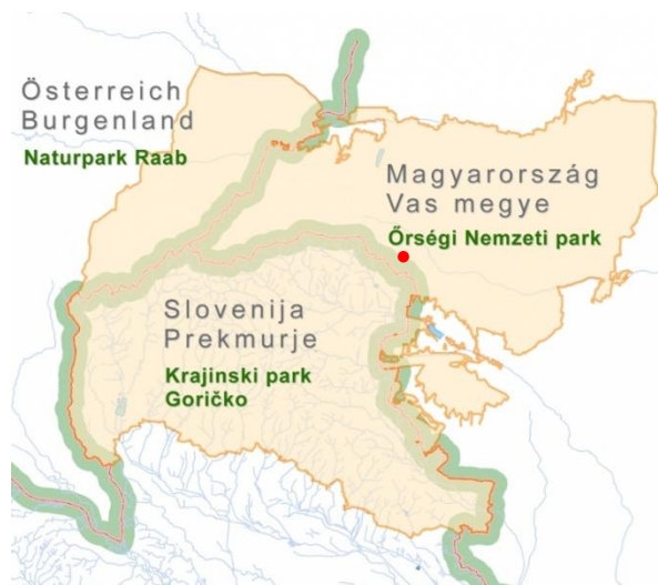
Slika 2: Trideželni park Goričko-Raab-Órség

Narodni park Órség se nahaja na zahodu Madžarske v županiji Vas, tik ob slovenski meji, in predstavlja eno najbolj ohranjenih kulturnih krajin v regiji. Gre za pomembno zavarovano območje z izjemno naravno in kulturno vrednostjo, znano po mozaični krajini travnikov, gozdov, mokrišč ter razpršene poselitve, ki odraža stoletja trajnostnega sobivanja človeka z naravo v nekdanji stražni krajini. Območje odlikuje bogata biotska