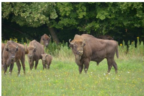
Slika 4: Obisk pašnika evropskih bizonov ali zobrov ( Bison bonasus ).